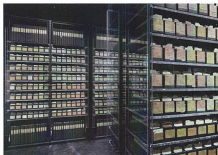
Fichier de l'Agence internationale des prisonniers de guerre. ©MICR photo Alain Germond